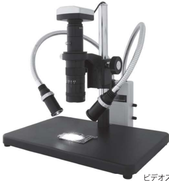
ビデオズーム顕微鏡XV-330(別売)

ベースプレート上に顕微鏡を配置して使用できるので非常に省スペースな設計となっております。