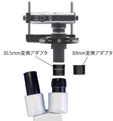
鏡筒内径が30mm、もしくは30.5mmの顕微鏡に接続する場合