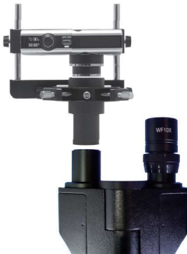
鏡筒内径23.2mmの顕微鏡に接続する場合