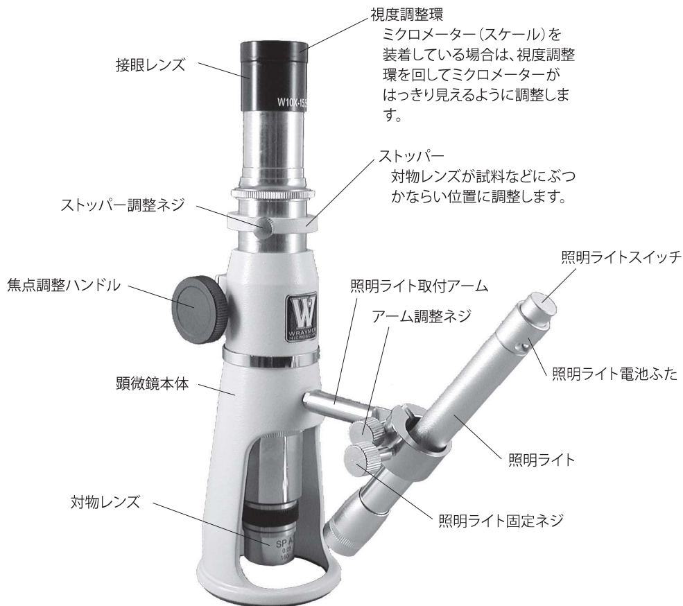
図 1. 各部の名称と働き